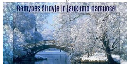
Ramybės širdyje ir jaukumo namuose!